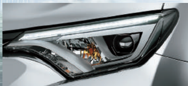
Faros delanteros Bi-LED con nivelación automática en altura y sensor crepuscular