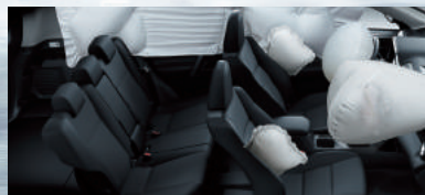
7 airbags: de rodilla para conductor, frontales y laterales para conductor y acompañante y de cortina para conductor, acompañante y pasajeros