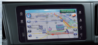
Audio con pantalla táctil de 7" con navegador satelital (GPS), CD, MP3, Bluetooth®, entradas auxiliares y USB