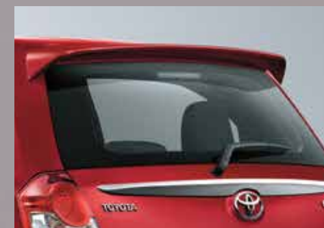
Spoiler trasero. 2