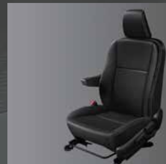
Asientos tapizados en cuero con apoyabrazos. 2