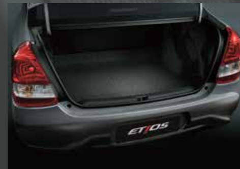
Capacidad de carga de baúl del Sedán 562 litros. 1

El asiento trasero es rebatible en todas las versiones y, sumado al asiento del conductor con regulación vertical y apoyabrazos, contribuyen a una experiencia de viaje más placentera. A donde quieras ir, el Etios te acompaña.