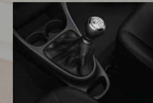
Caja manual de 6 marchas.