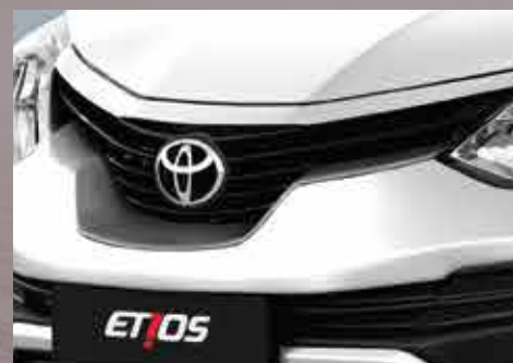
Parrilla con detalle cromado. 6