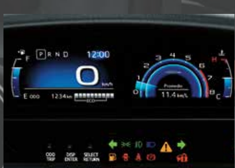
Display de información múltiple digital.

Entre sus aspectos tecnológicos se destacan dos pantallas de alta resolución: una muestra el velocímetro digital y la otra exhibe el tacómetro y datos como temperatura de motor, consumo y autonomía, entre otros. También presenta un audio con pantalla táctil de 7", MP3, Bluetooth®, USB, entrada auxiliar de audio y conexión con smartphone.