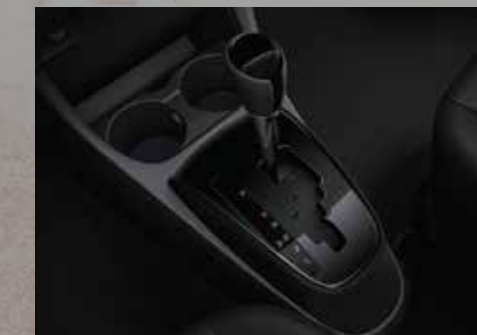
Caja automática de 4 marchas. 1