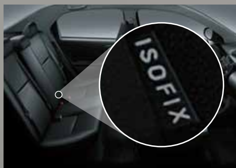
Sistema de anclaje ISOFIX (x2) en asientos traseros.