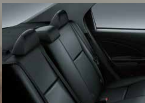
Tres apoyacabezas traseros.