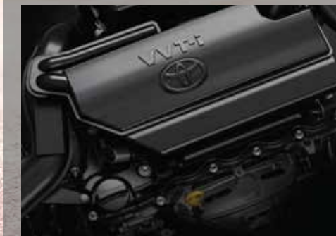
Motor 2NR-FE, 16 válvulas con sistema dual VVT-i (Variación inteligente de sincronización de válvulas).