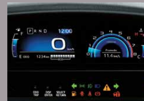
Display de información múltiple.