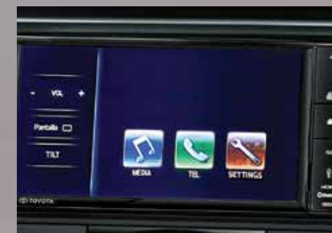
Audio con pantalla táctil de 7", MP3, Bluetooth®, USB, entrada auxiliar de audio y conexión con smartphone. 5