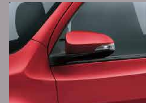
Espejos exteriores con luz de giro incorporada y regulación eléctrica. 3