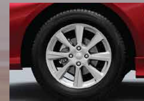
Llantas de aleación de 15". 1