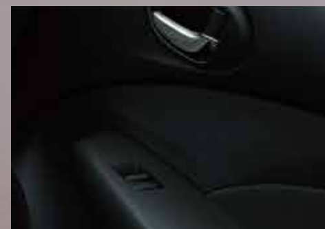
Levantavidrios eléctricos en las 4 puertas.