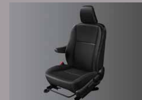
Asientos tapizados en cuero con apoyabrazos (sólo en AT). 6