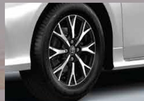
Diseño de llantas exclusivo de 15". 4