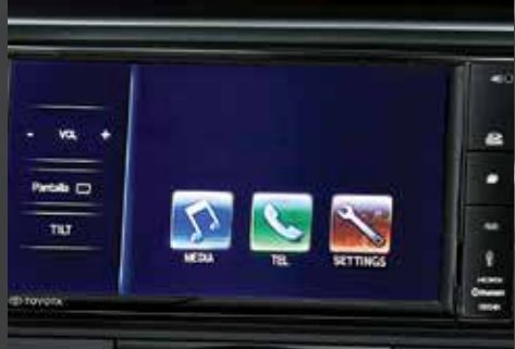
Audio con pantalla táctil de 7", MP3, Bluetooth®, USB, entrada auxiliar de audio y conexión con smartphone. 1