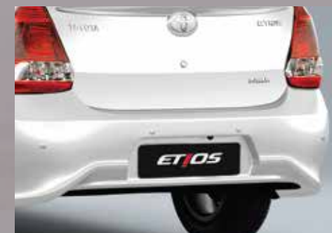
Sensor de estacionamiento trasero. 6