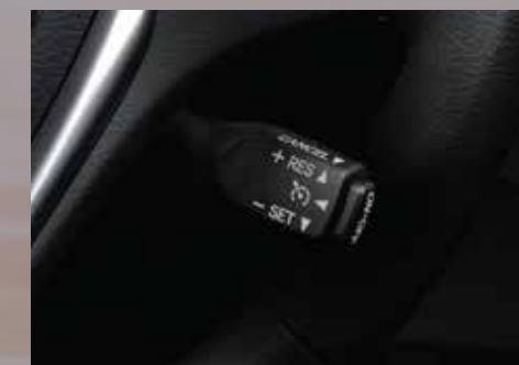
Control de velocidad crucero. 7