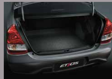
Apertura de baúl y tanque de combustible desde el interior en versiones Sedán.