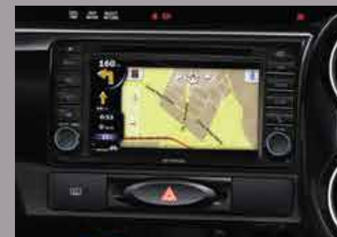
Audio con GPS, pantalla táctil de 6,2", TV digital, reproductor de DVD, MP3, Bluetooth® y USB. 6