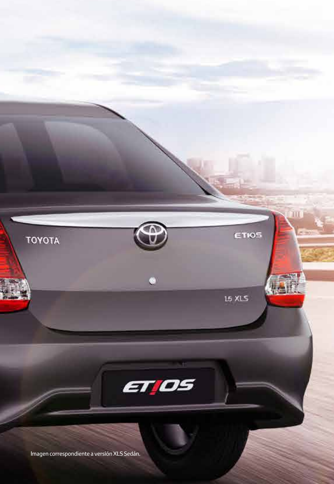
Imagen correspondiente a versión XLS Sedán.