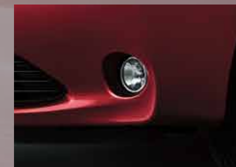
Faros antiniebla delanteros. 3