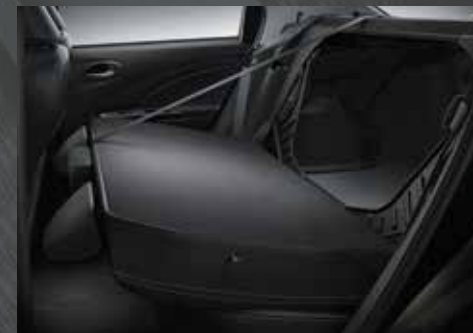
Asiento trasero rebatible en todas las versiones para mayor capacidad de carga.