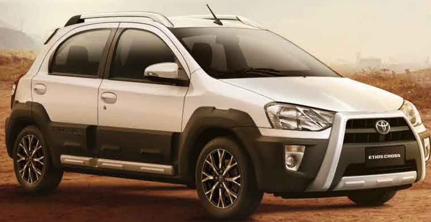
Imagen correspondiente a versión Cross.

También presenta el tercer apoyacabezas trasero y sistema de anclaje ISOFIX, elementos que hacen del Etios una elección totalmente segura.