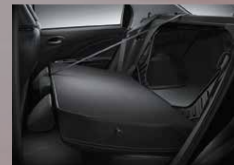
Asiento trasero rebatible.