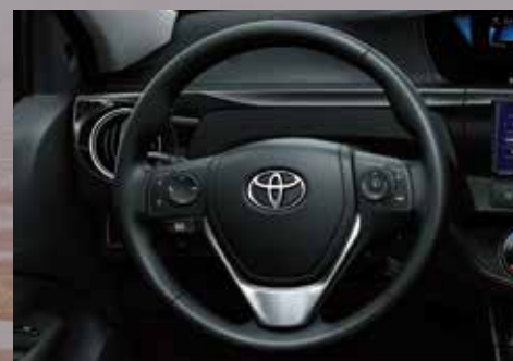
Volante de cuero con control de audio, display de información múltiple y teléfono. 3